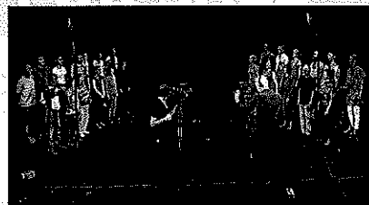
SJUNGANDE DIALOG. I Tiggandets kör och Givandets kör möts kören, en bestående av tiggare, den andra av givare, i en sjungande dialog.